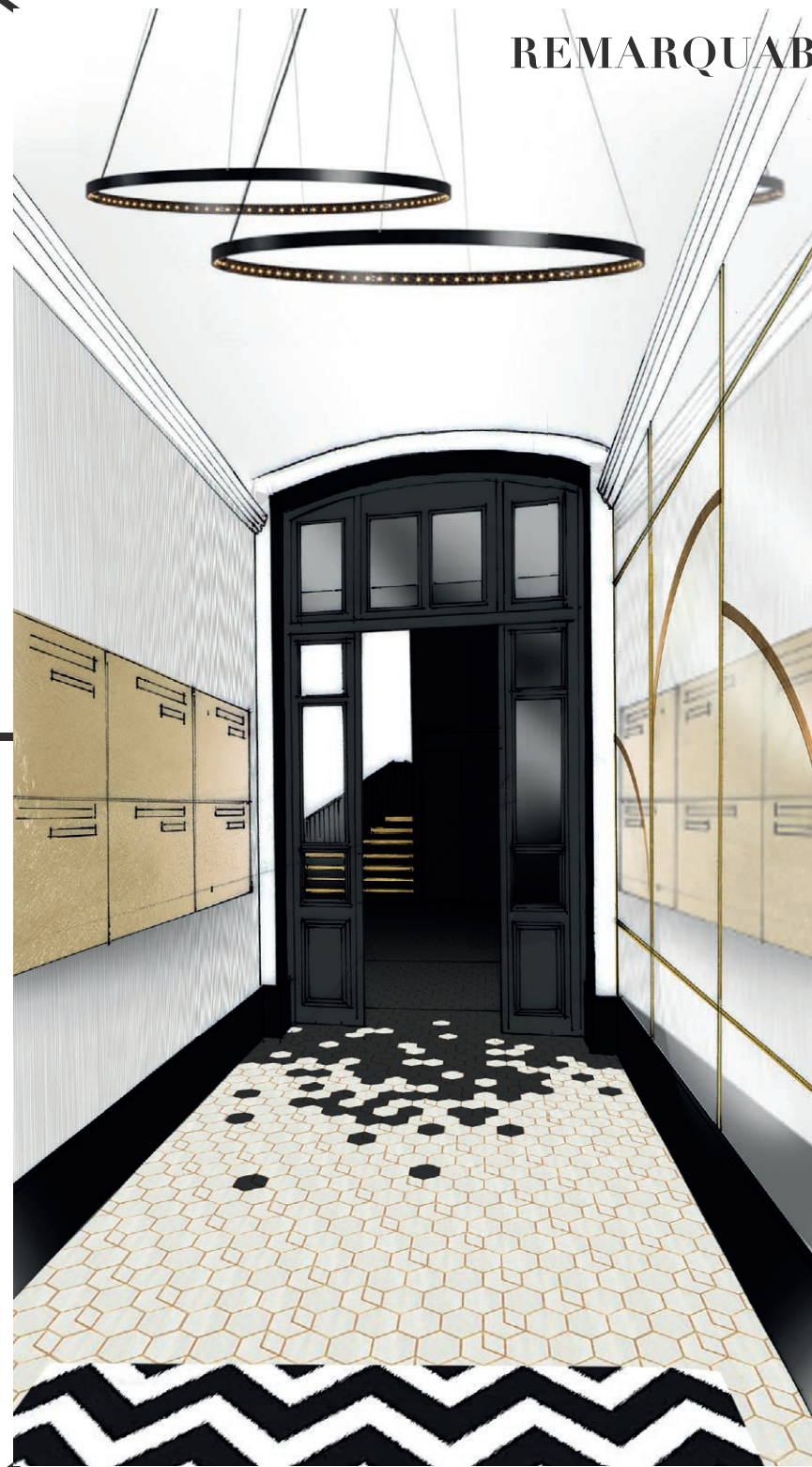
Illustration d'ambiance du hall d'entrée de la résidence, non contractuelle