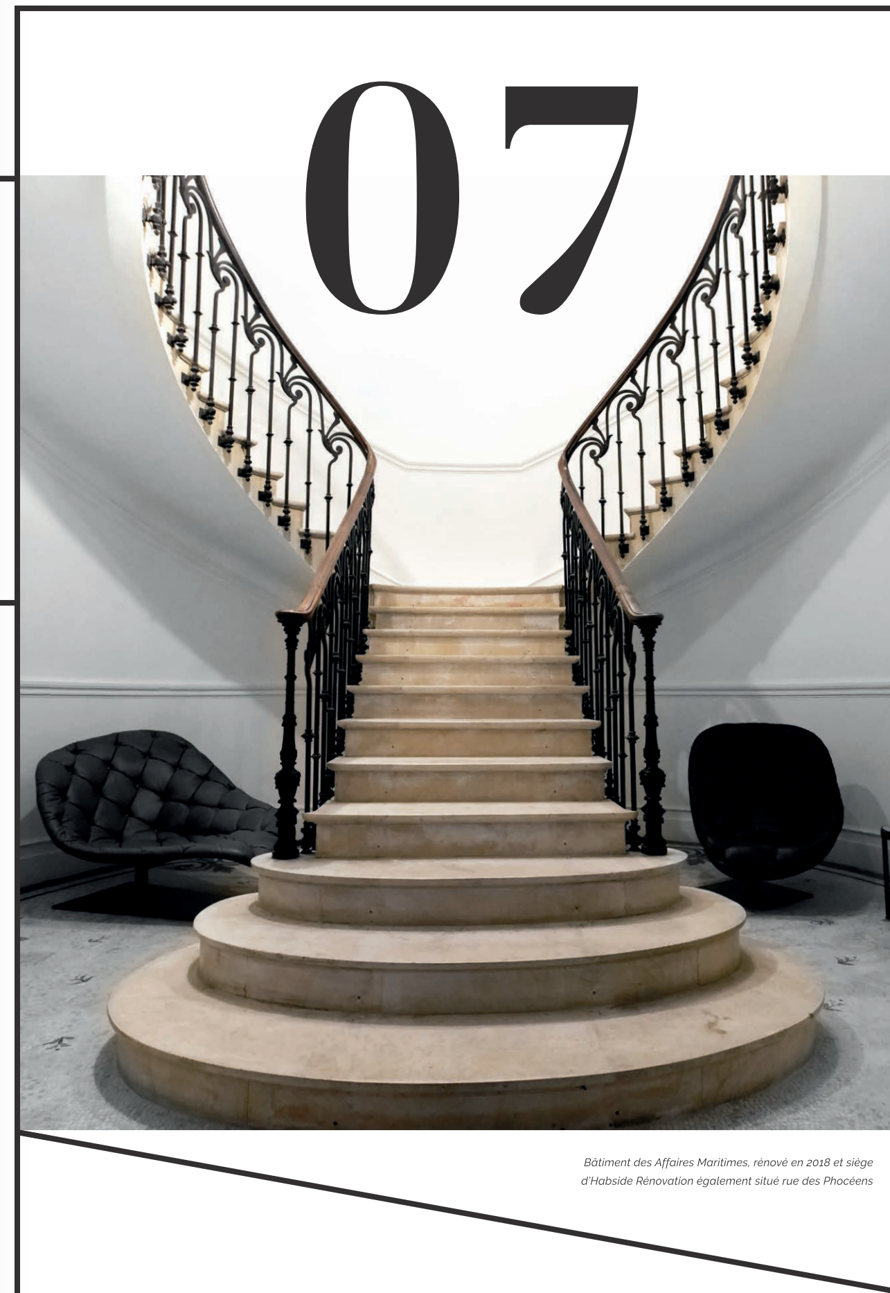
Bâtiment des Affaires Maritimes, rénové en 2018 et siège d'Habside Rénovation également situé rue des Phocéens

"Chez Habside Rénovation, nous rendons hommage à la pierre que nous aimons, nous imaginons des espaces dans lesquels nous souhaiterions vivre et nous réalisons ces lieux pour et avec vous."